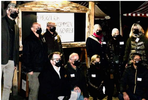
Ok Freiwilligenfest vor dem Rathaus

Alle zwei Jahre veranstaltet die Stadt Frauenfeld ihr Freiwilligenfest. In Zusammenarbeit mit dem DaFa wurden die freiwilligen Helfer der 56 Mitgliedervereine eingeladen, um ihnen für die geleisteten Freiwilligenstunden zu danken. In den letzten Jahren nahmen jeweils zwischen 200 und 250 Personen an dieser Veranstaltung im Casino teil. Wegen Corona setzte das Ok auf ein anderes, neues Konzept.