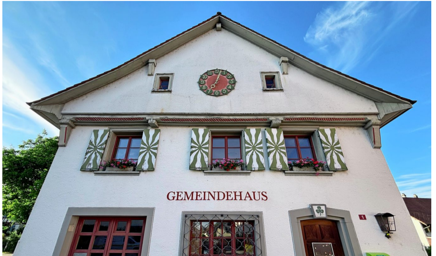
Das alte Basadinger Gemeindehaus: Im ersten Stock entsteht ein Übergangs-Kindergarten.